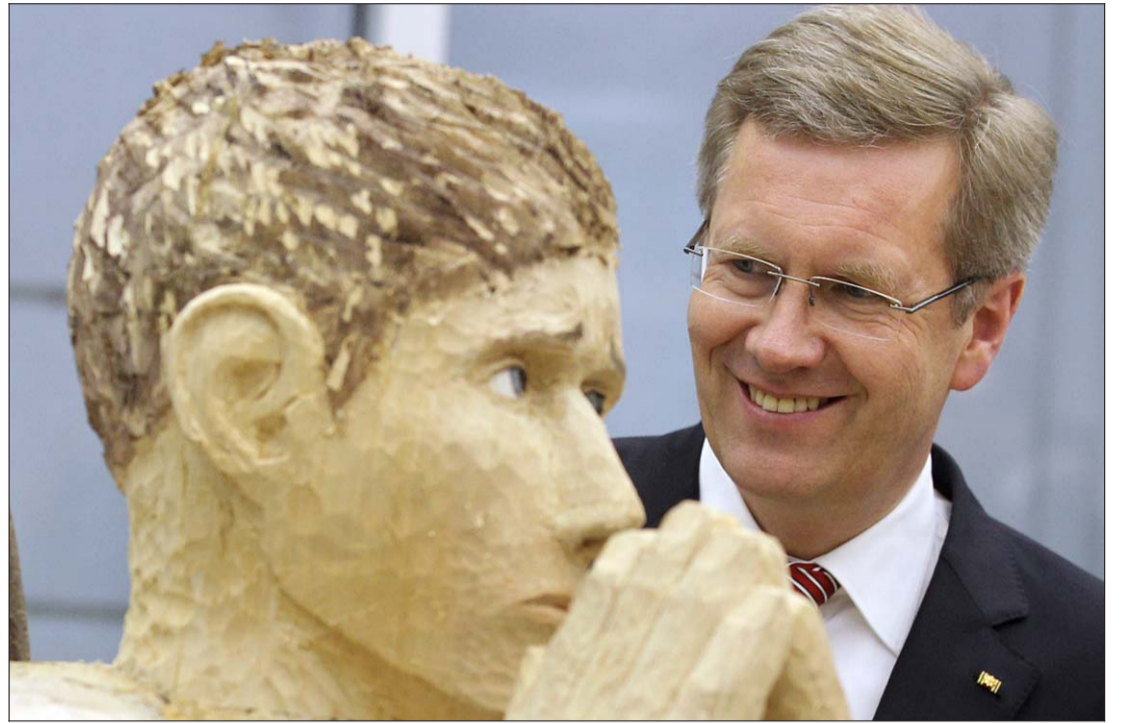
Bevor er seine Unterschrift unter das Gesetz setzte, besuchte Wulff die Berliner Kunsthochschule UdK. Hier bewundert er eine Plastik von Peter Kröning mit dem Titel „Wir haben nicht genug gelitten“.

Berlin. Bundespräsident Christian Wulff (CDU) hat gestern das umstrittene schwarz-gelbe Gesetzespaket mit längeren Atomlaufzeiten unterschrieben. Wulff hält die Gesetze für verfassungsgemäß zustande gekommen. Mehrere SPD-regierte Länder wollen nun vor dem Bundesverfassungsgericht gegen das Laufzeitplus von im Schnitt zwölf Jahren für die 17 deutschen Meiler klagen. Sie wehren sich dagegen, dass die Regierung die längeren Laufzeiten ohne Zustimmung des Bundesrates beschlossen hat, in dem Schwarz-Gelb keine Mehrheit mehr hat.