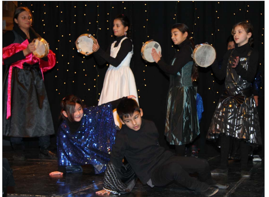
Viel Fantasie steckt in der Aschenputtel-Interpretation der Kinder und Jugendlichen von „Maro Temm“.

Befördert werden soll mit dem Projekt die Erkenntnis, dass es viel Spaß machen kann, regelmäßig an einer Sache dran zu bleiben. Auch