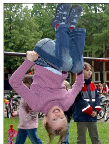
Kinder schätzen laut „Werte-Monitor“ Freundschaft, Familie – und Geld.